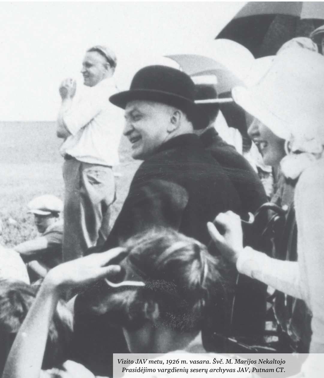
Vizito JAV metu, 1926 m. vasara.