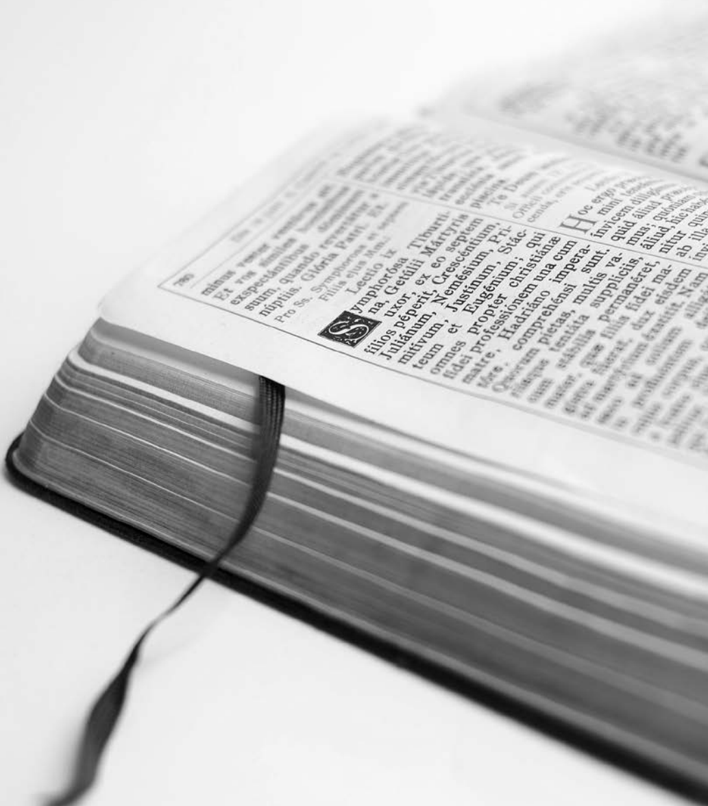
Breviorius. Pal. Jurgio Matulaičio asmeninių daiktų kolekcija, Pal. Jurgio Matulaičio muziejus Marijampolėje.