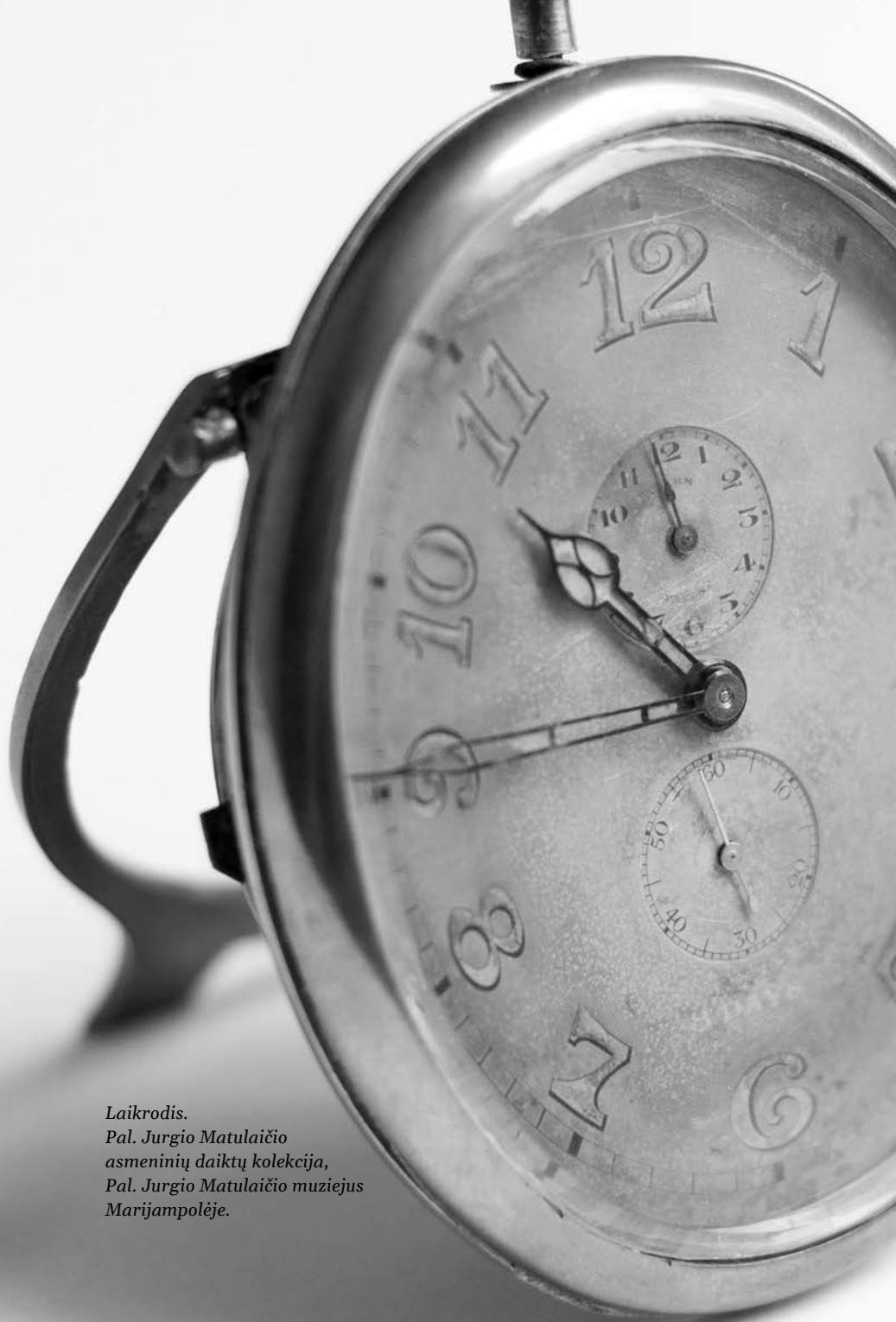
Laikrodis. Pal. Jurgio Matulaičio asmeninių daiktų kolekcija, Pal. Jurgio Matulaičio muziejus Marijampolėje.