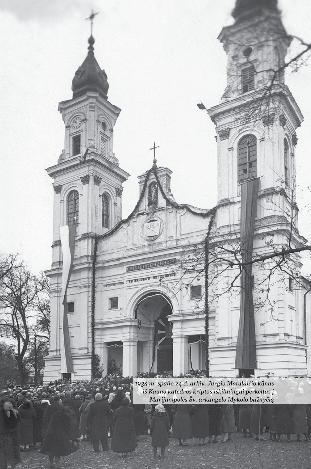
1934 m. spalio 24 d. arkiv. Jurgio Matulaičio kūnas iš Kauno katedros kriptos iškilmingai perkeltas į Marijampolės Šv. arkangelo Mykolo bažnyčią