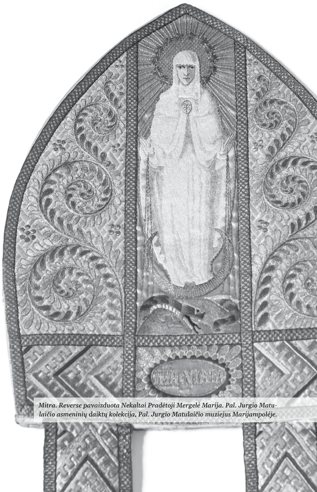
Mitra. Reverse pavaizduota Nekaltai Pradėtoji Mergelė Marija. Pal. Jurgio Matulaičio asmeninių daiktų kolekcija, Pal. Jurgio Matulaičio muziejus Marijampolėje.