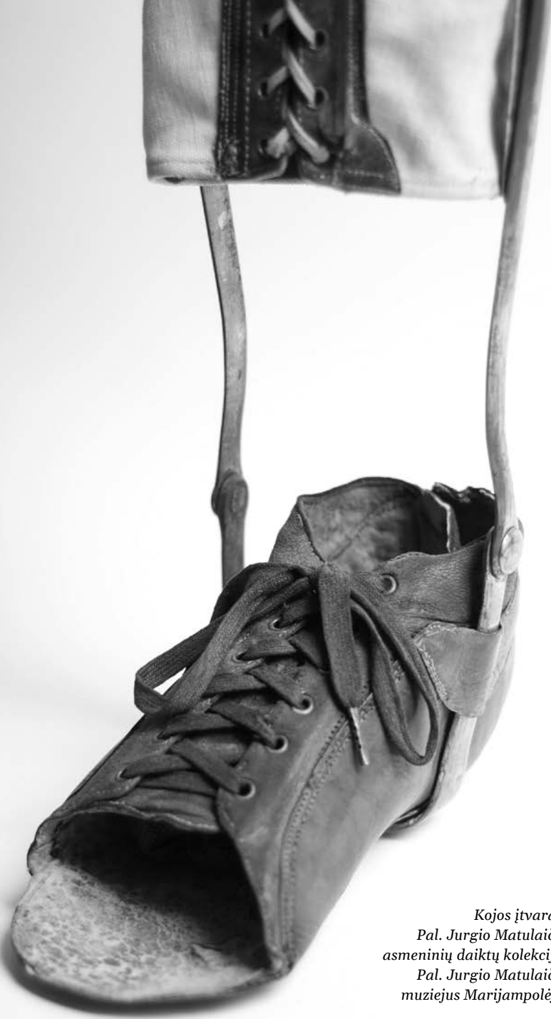
Kojos įtvaras. Pal. Jurgio Matulaičio asmeninių daiktų kolekcija, Pal. Jurgio Matulaičio muziejus Marijampolėje.