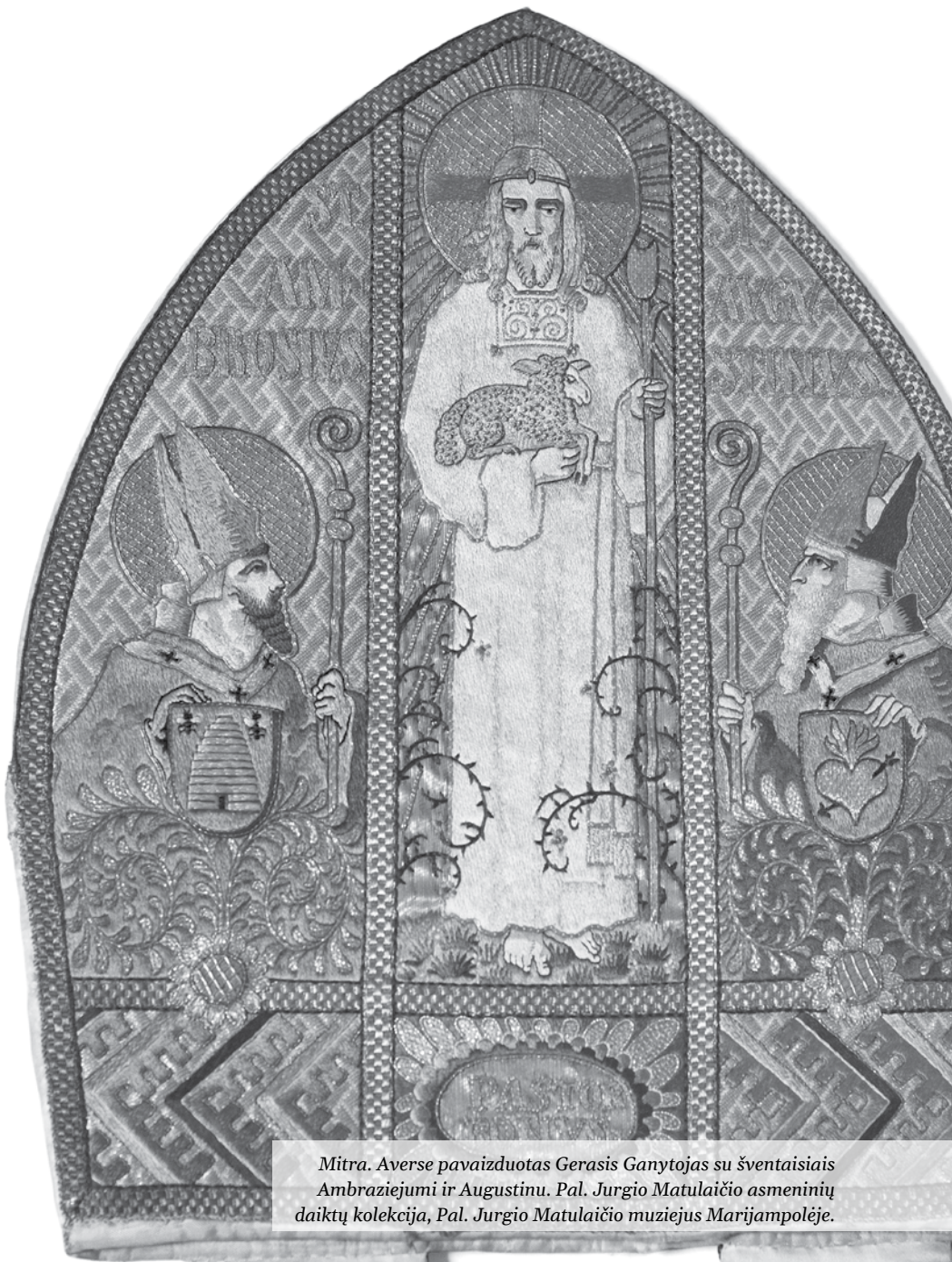
Mitra. Averse pavaizduotas Gerasis Ganytojas su šventaisiais Ambraziejumi ir Augustinu. Pal. Jurgio Matulaičio asmeninių daiktų kolekcija, Pal. Jurgio Matulaičio muziejus Marijampolėje.