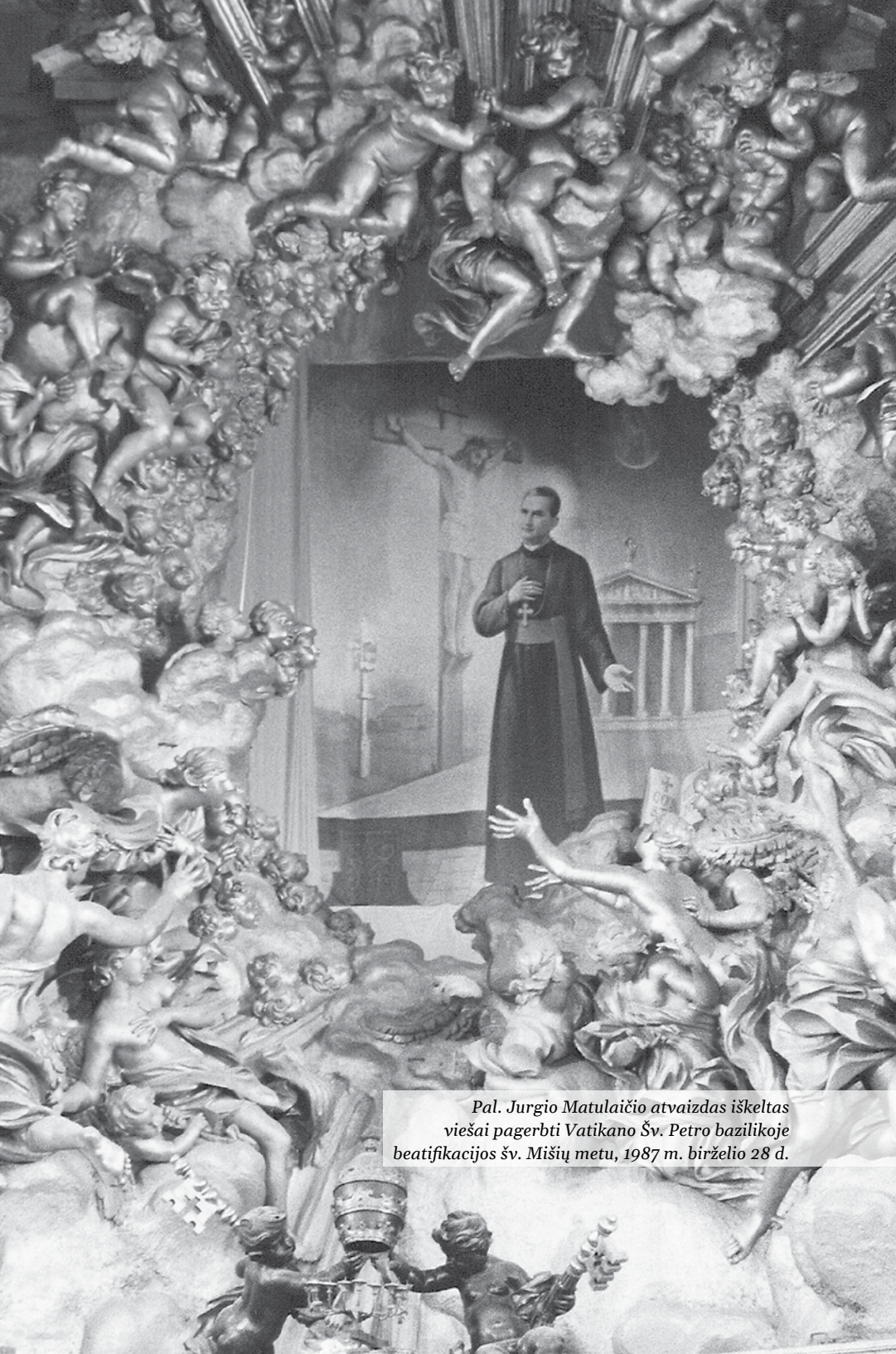
Pal. Jurgio Matulaičio atvaizdas iškeltas viešai pagerbti Vatikano Šv. Petro bazilikoje beatifikacijos šv. Mišių metu, 1987 m. birželio 28 d.