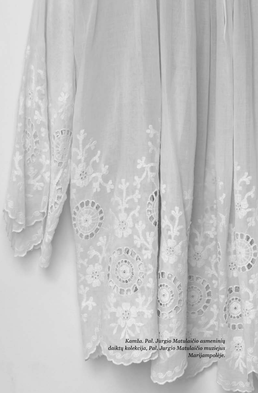
Kamža. Pal. Jurgio Matulaičio asmeninių daiktų kolekcija, Pal. Jurgio Matulaičio muziejus Marijampolėje.