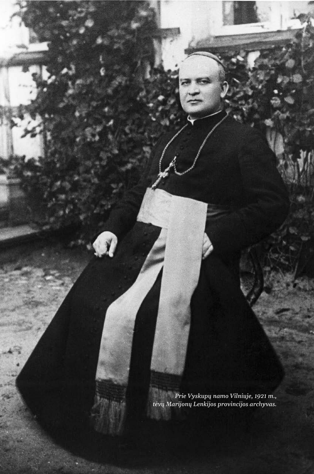
Prie Vyskupų namo Vilniuje, 1921 m., tėvų Marijonų Lenkijos provincijos archyvas.