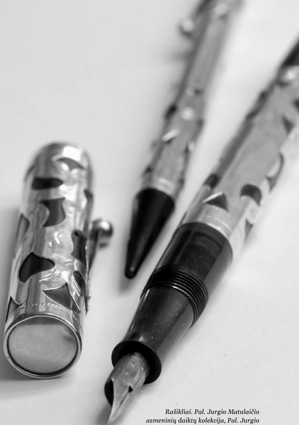
Rašikliai. Pal. Jurgio Matulaičio asmeninių daiktų kolekcija, Pal. Jurgio Matulaičio muziejus Marijampolėje.