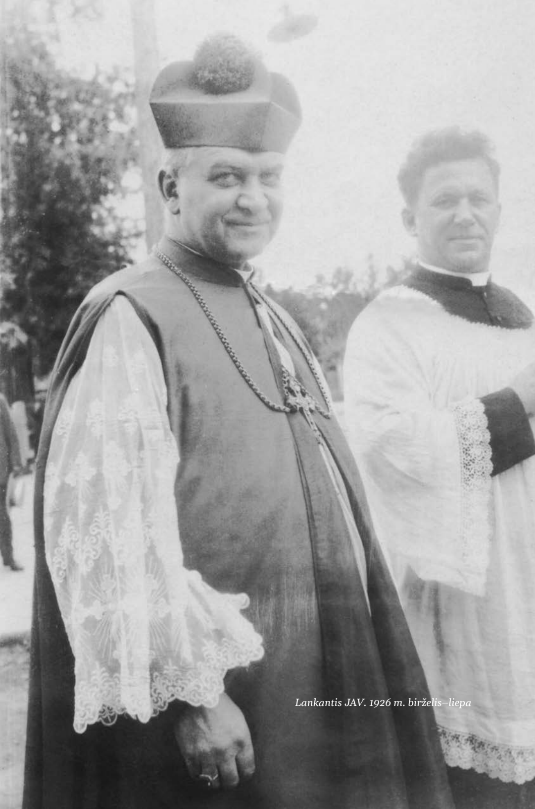
Lankantis JAV, 1926 m. birželis–liepa