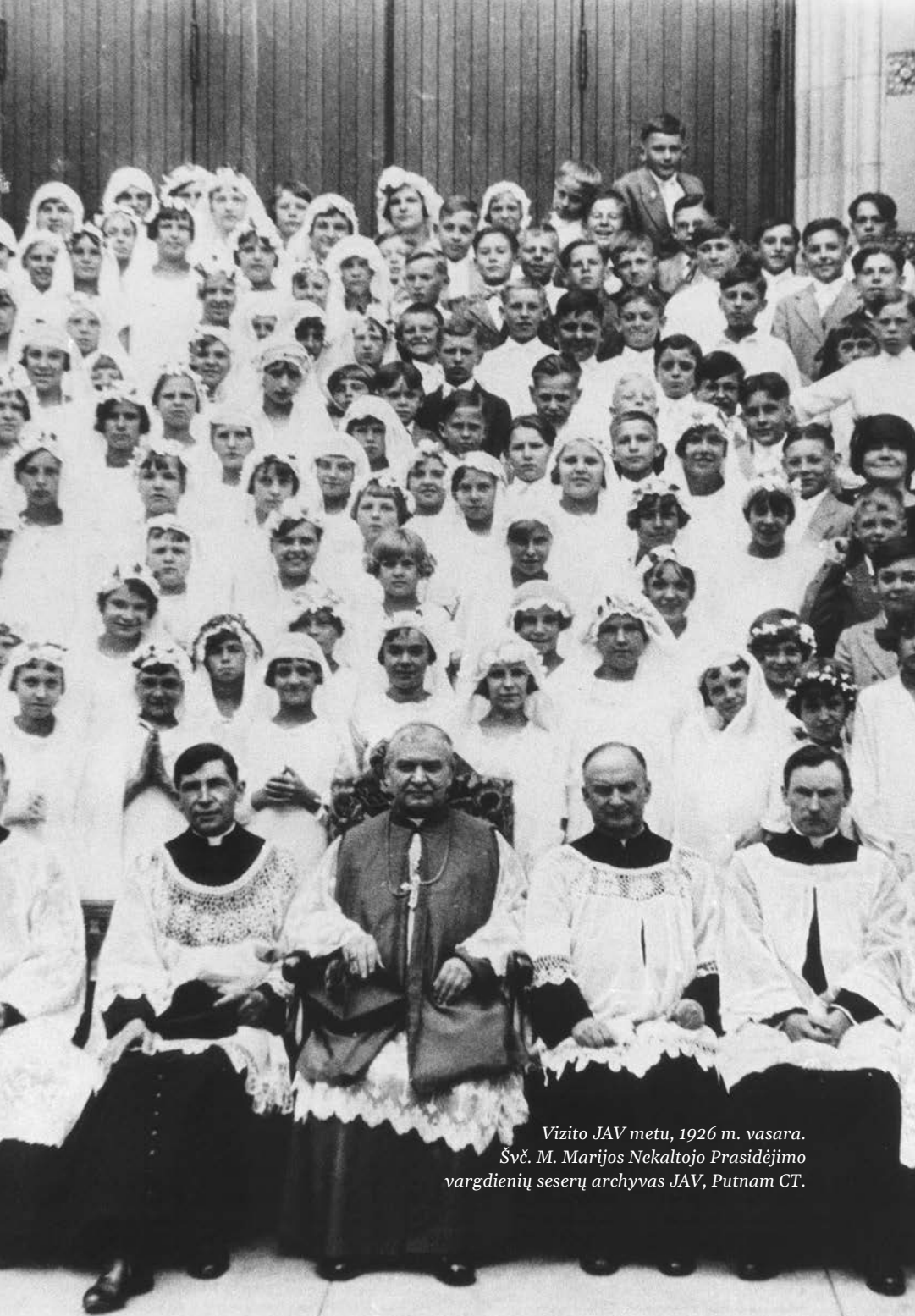
Vizito JAV metu, 1926 m. vasara. Švč. M. Marijos Nekaltojo Prasidėjimo vargdienių seserų archyvas JAV, Putnam CT.